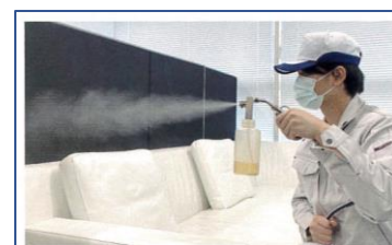
専用スプレー使用・簡単施工